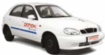
Daewoo Lanos manualna skrzynia biegów